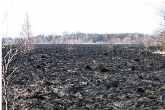
Materiał promujący akcję „Stop wypalaniu traw”

Do połowy marca strażacy sześć razy gasili płonące łąki w powiecie oświęcimskim, z czego aż trzy razy na terenie gminy Oświęcim. Trawy paliły się w rejonie ulicy Grojeckiej w Zaborzu i dwukrotnie w okolicach Kasztanowej w Grojcu.