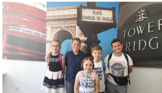
Pasjonaci języka angielskiego ze szkoły we Włosienicy.

Uczniowie rozwijają pasje w kołach zainteresowań: matematycznym, językowym, teatralnym, wokalnno-tanecznym i plastycznym. Biorą udział w przedmiotowych konkursach powiatowych, wojewódzkich i ogólnopolskich, takich jak: Archimedes.Plus, Olimpus i Olimpusek, Kangur, Pangea, Lingua.Plus, Ogólnopolskie Dyktando, Krakowska Matematyka. Uczestniczą także w gminnych i powiatowych konkursach artystycznych (np. konkur-