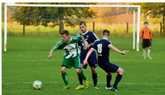
Piłkarze z Rajsko będą w rundzie rewanżowej gonili prowadzący w tabeli oświęcimskiej klasy A Team Sport Hejnał Kęty. Fot. Andrzej Rzycki

Trzy zwycięstwa, dwa remisy i dwie porażki – tak grał wicelider oświęcimskiej klasy A w okresie przygotowawczym.