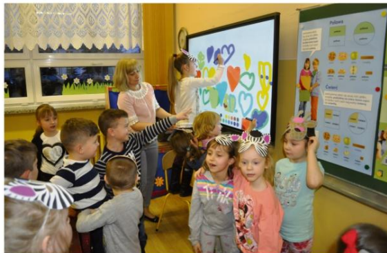
Przyszli uczniowie poznawali Szkołę Podstawową w Grojcu podczas Dnia Otwartego, 13 marca tego roku.

nych lub koordynowanych przez Gminę Oświęcim. W pierwszej dekadzie marca stu trzecioklasistów uczyno się jeździć na nartach. O programie "Jeżdżę z głową" piszemy obszerniej na stronie 7.