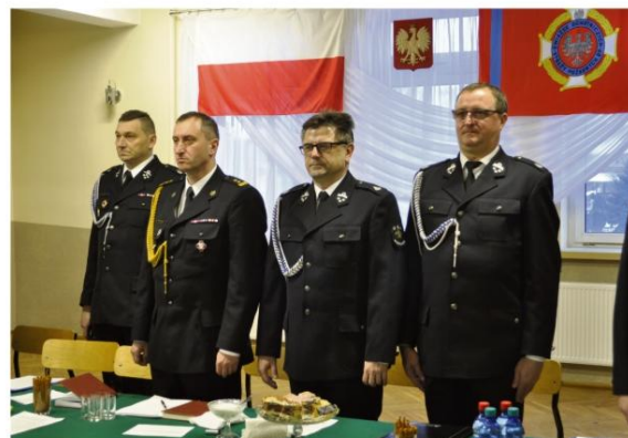
Zebranie OSP Włosienica 3 marca 2018 roku.