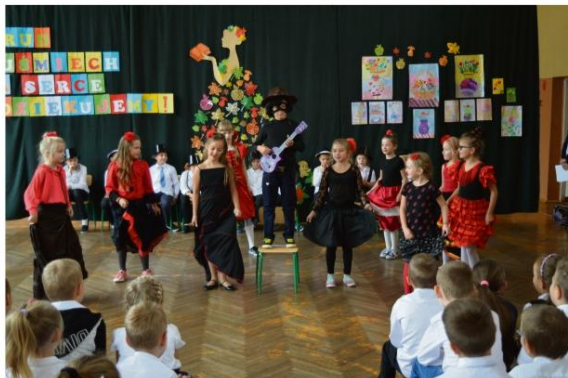
Przedstawienie w Szkole Podstawowej w Babicach.

Należy do elitarnego grona Szkół Uczących Się (SUS). Jest jedną z dziewięciu szkół będących laboratoriami praktyki edukacyjnej. Nowatorskie metody prezentowane są rodzicom. Zaproszeni do zajęcia miejsc w ławkach szkolnych mogą zmierzyć się z nowoczesnym stylem prowadzenia lekcji.