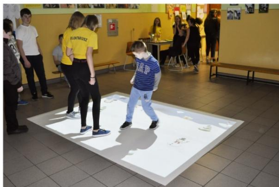
Interaktywna podłoga w Szkole Podstawowej w Grojcu.

W szkole w Brzezince nie ma dzwonek. Wysoki poziom nauczania potwierdzają wyniki egzaminów