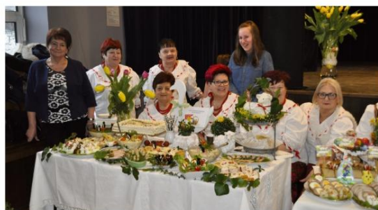
KGW Włosienica – reprezentantki Gminy Oświęcim.

X Prezentacja Regionalnych Potraw Wielkanocnych sztykanych na Święta na ziemi oświęcimskiej odbyła się 18 marca w Gminnym Centrum Kultury w Polance Wielkiej.