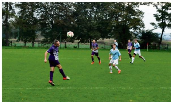
Przed nami arcykiewawie zapowiadająca się runda rewanżowa na boiskach oświęcimskiej klasy A i B.

terenie w pierwszej wiosennej kolejce zagra tylko Górnik. Brzeszczanie będą podejmowali Przeciszowię, w której doszło do kilku poważnych korekt personalnych. Ten zespół powinien być wiosną silniejszy i może pokusić się w Brzeszczach o niespodziankę. W pierwszym starciu między tymi zespołami w Przeciszowie goście wy-