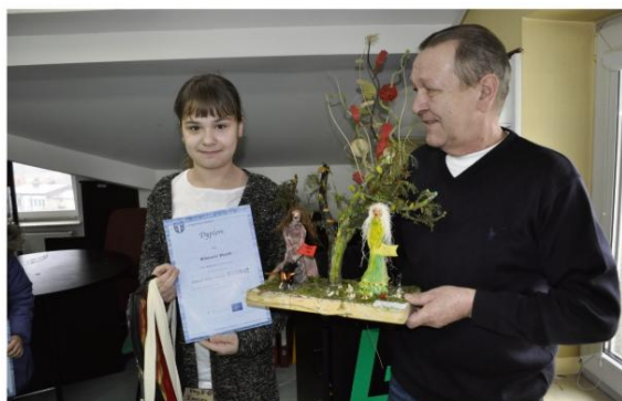
16 marca został rozstrzygnięty konkurs plastyczny przygotowany przez ekodoradcę dla uczniów szkół podstawowych „Odejdź zimo, odejdź smogu!” na najciekawszą pracę będącą wyobrażeniem smogu. Na zdjęciu autorka zwycięskiej pracy w kategorii uczniów klas IV-VII.

Ekodoradca uczestniczy też w Zebra- niach Wiejskich w marcu i kwietniu