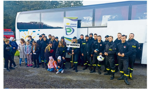
Drużny z Włosienicy i druhowie z Brzezinki na zawodach wojewódzkich.

Zwyczajnie zespoły w konkurencji musztry to w poszczególnych kategoriach: dziewczęta z Łęk, chłopcy z Jawiszowic oraz dorosłe drużyny kobiet i mężczyzn z Poręby Wielkiej. Wyloniono również najlepszy oddział w powiecie oświęcimskim, a został nim Oddział Miejsko-Gminny Związku OSP RP w Oświęcimiu.