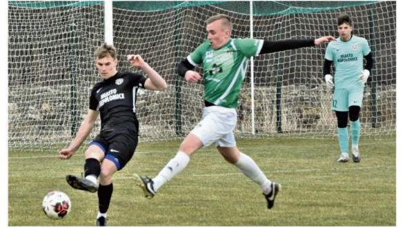
Rajsko nie obroni Pucharu Polski wywalzonego w dwóch ostatnich sezonach na szczeblu oświęcimskiego podokręgu. W półfinale uległo po rzutach karnych Niwie Nowa Wieś.

68. Sędziował: Lukasz Łabaj z Oświęcimia. Żółte kartki: Matlak – Mateja, Stawowczyk, Holewa. Widzów: 100.