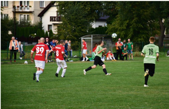
Znakomicie w rundzie jesiennej radzi sobie Puls. Broszkowiczanie po dziewięciu kolejkach zajmują pozycję wicelidera i mają tylko trzy punkty straty do prowadzącej Zgody Malec.

wiceliderzy urządzili sobie strzelecki trening, gromiąc na swoim obiekcie