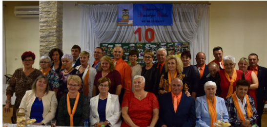
Fot. Ryszard Rysza