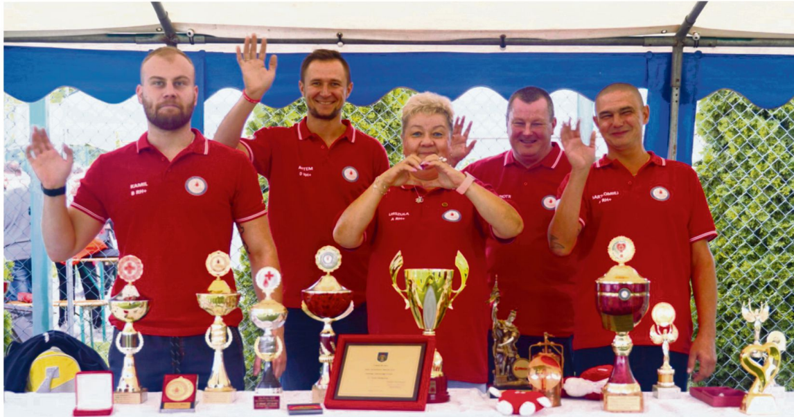
Stoisko Honorowych Dawców Krwi