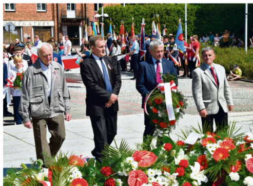
W uroczystościach 3 maja w Oświęcimiu wzięli udział członkowie Koła Pszczelarzy Ziemi Oświęcimskiej.

Kwiaty na płycie pomnika na placu Kościuszki złożyli