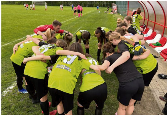
Piłkarki KKPNI Iskry zajmują miejsce w samym środku trzecioliogowej stawki.