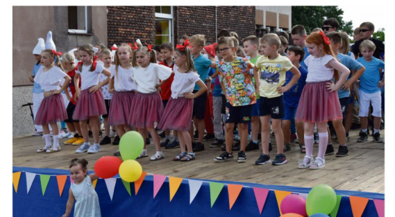
Dzień Rodziny w Szkole Podstawowej we Włosienicy.