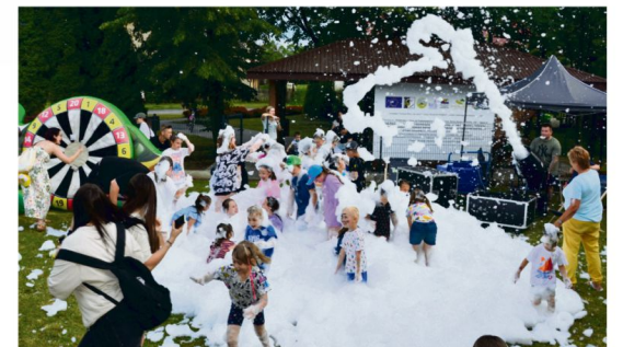
Dzień Dziecka w Broszkowicach.