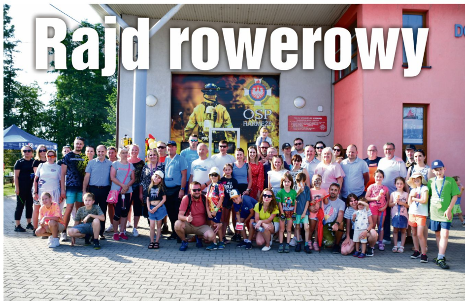
Uczestnicy Rajdu przed remizą OSP w Harmężach.