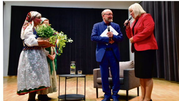
Członkinie Amatorskiego Ruchu Teatralnego obdarowały Artura Barcisia naczem ogrodowych kwiatów.

raczej domownikiem i dobrym znajomym z racji wielu lubianych i cenionych ról, które można śledzić na ekranie