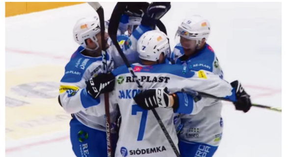
Przed hokejowymi fanami nie tylko z Oświęcimia, ale i całego regionu wyjątkowy sezon. Re-Plast Unia po raz pierwszy w swojej historii zagra w elitarniej Lidze Mistrzów.