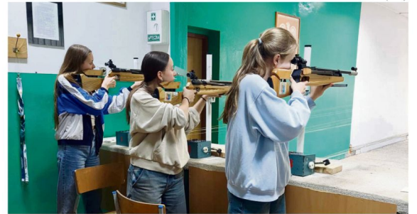
W pierwszej edycji powiatowych mistrzostw w strzelectwie sportowym uczniów szkół podstawowych świetnie spisała się młodzież z oświęcimskiej gminy.