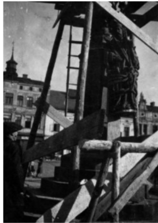
Demontaż pomnika św. Jana Nepomucena w Oświęcimiu.