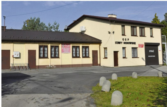
Dach Remisy – Domu Ludowego w Stawach Monowskich został wyremontowany w 2020 roku.

Kolejną bardzo ważną inwestycją był remont ulicy Centralnej. Zasadność tego przedsięwzięcia była bezapelacyjna. Przy tej drodze powstało kilka nowych i pięknych domów, a właśnie na tym odcinku ulica Centralna, która jest drogą powiatową, przypominała polny trakt z wieloma dziurami i zniszczonym poboczem. Jednakże inwestycja nie zdobyła akceptacji