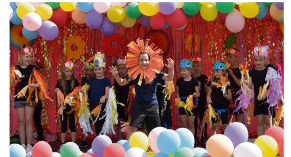
10 urodziny Niepublicznego Przedszkola „Gniazdko” w Rajsku.