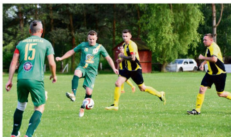
Na zakończenie sezonu 2023/24 piłkarze z Poręby Wielkiej mierzą się na wyjeździe w derbowym starciu z Iskrą Brzezinka.