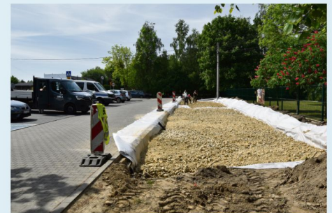
Półowa maja – prace przy rozbudowie parkingu przy przedszkolu na Zaborzu.

Parking przy Przedszkolu Samorządowym został rozbudowany. Koszt tej inwestycji to około 110 tys. złotych. W tej kwocie prawie 54 tys. złotych to środki sołeckie.