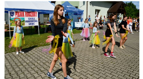
Piknik Rodzinny Szkoły Podstawowej w Grojcu.